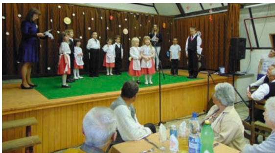
A helyi óvodások köszöntötték az időseket

Önök azok, akik előttünk járnak az úton, önöktől örököltük meg ezt a települést, tanultuk meg a nyelvet, amellyel szót értünk egymással. Önök hordozták vállaikon a falut, kemény munkával keresték a kenyeret, építettek benne hajlékot, nevelték a gyerekeket. Tiszteletünk